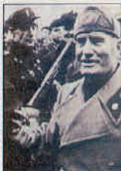
Ritro a pagina 15