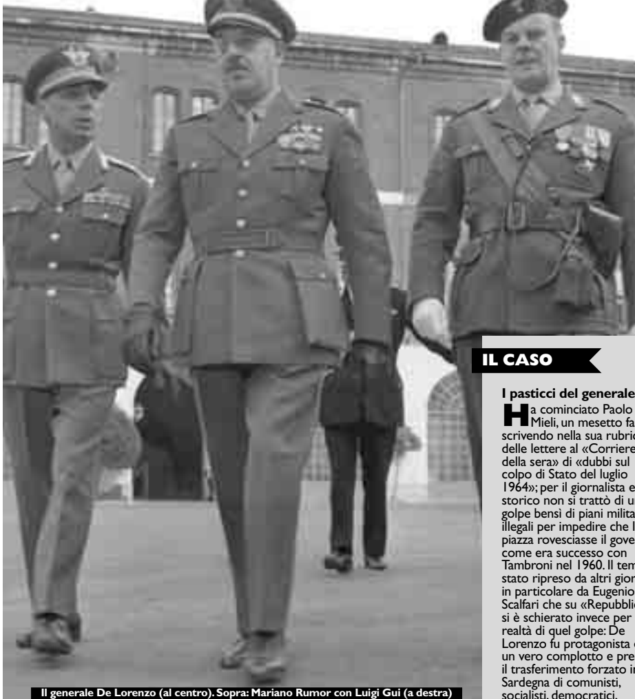
Il generale De Lorenzo (al centro). Sopra: Mariano Rumor con Luigi Gui (a destra)

La caduta del primo governo di centrosinistra, presieduto da Aldo Moro, scoraggiava: «Il Paese è stanco - annotavo sotto la data del 1° luglio 1964 -, ha paura della crisi economica. La politica non ce la fa a respirarla. Le manca un serio substrato culturale, tuttavia non c'è posto per una nuova esperienza fascista. Il sistema pluralista dei partiti è solidissimo. Il margine per l'irrazionale è ridottissimo». Tuttavia la politica come pura amministrazione del benessere, delle «comodità che regolano tutto», mi sembrava avesse fatto fallimento. Come spesso accadeva in queste circostanze politiche molto confuse, chiesi aiuto all'amico Tommaso Morlino, ma questa volta lo trovai «più scoraggiato» di me: «Ma la bestia è la Democrazia Cristiana», que-