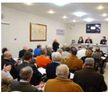
Il momento dell'aggiudicazione