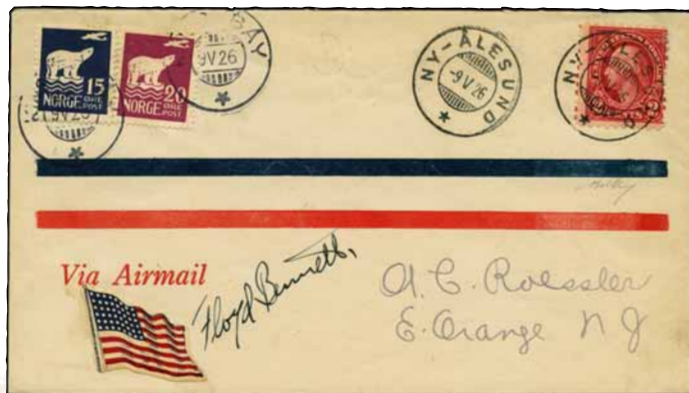
Lotto n.21 base € 2.000,00 realizzo € 3.600,00