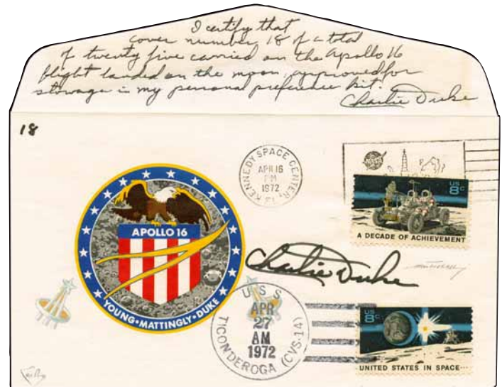
Lotto n.151 base € 42.000,00 realizzo € 55.000,00

Numero lotti in asta: 182 Numero lotti venduti: 154 Percentuale lotti venduti: 85% Incremento percentuale medio sul prezzo base: 47% Durata dell'asta: 70 minuti