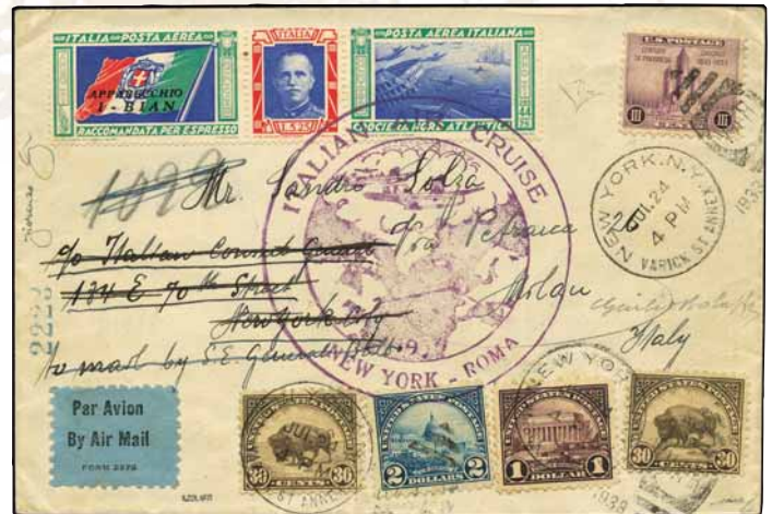
Lotto n.132 base € 5.000,00 realizzo € 15.000,00