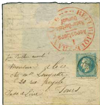
Lotto n.2 base € 3.000,00 realizzo € 4.700,00