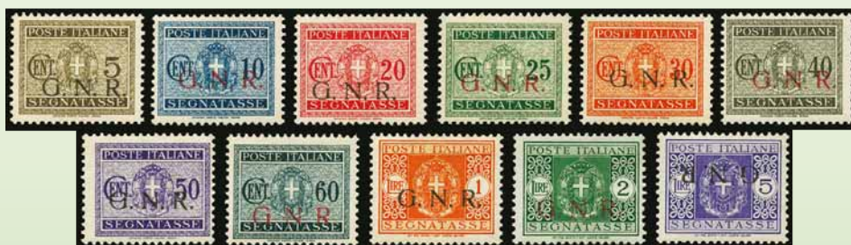
G.N.R. - Segnatasse lotto 707 base € 600,00