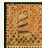
Risorgimento - Italia - lotto 458 base € 1.200,00