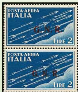
G.N.R. - Posta Aerea lotto 701 base € 450,00