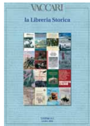
Il primo numero della "Libreria Filatelica" e della "Libreria Storica".

stimolo per continuare su questa strada. Ma ancora più appagante è l'opportunità di creare rapporti con studiosi e scrittori di alto livello dai quali c'è sempre da imparare, e la possibilità di condividere questo loro sapere con tutti i lettori.