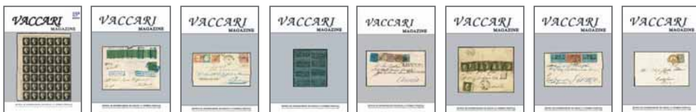
anno 2003 - n. 30 € 5,00 - cod. VM30 anno 2003 - n. 29 € 5,00 - cod. VM29 anno 2002 - n. 28 € 5,00 - cod. VM28 anno 2002 - n. 27 € 5,00 - cod. VM27 anno 2001 - n. 26 € 5,00 - cod. VM26 anno 2001 - n. 25 € 5,00 - cod. VM25 anno 2000 - n. 24 € 5,00 - cod. VM24 anno 2000 - n. 23 € 5,00 - cod. VM23