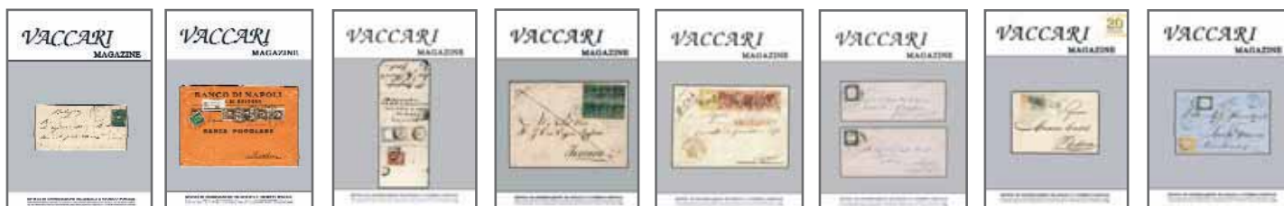
anno 2011 - n. 46 € 10,00 - cod. VM46 anno 2011 - n. 45 € 10,00 - cod. VM45 anno 2010 - n. 44 € 5,00 - cod. VM44 anno 2010 - n. 43 € 5,00 - cod. VM43 anno 2009 - n. 42 € 5,00 - cod. VM42 anno 2009 - n. 41 € 5,00 - cod. VM41 anno 2008 - n. 40 € 5,00 - cod. VM40 anno 2008 - n. 39 € 5,00 - cod. VM39