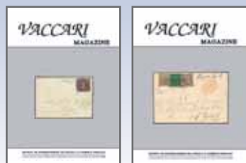
anno 2014 - n. 51 e 52 € 35,00 - cod. 2014E

(numero singolo € 20,00) + spese di spedizione