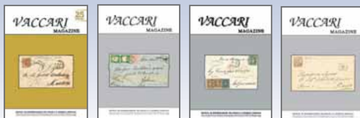
anno 2013 - n. 50 € 10,00 - cod. VM50 anno 2013 - n. 49 € 10,00 - cod. VM49 anno 2012 - n. 48 € 10,00 - cod. VM48 anno 2012 - n. 47 € 10,00 - cod. VM47