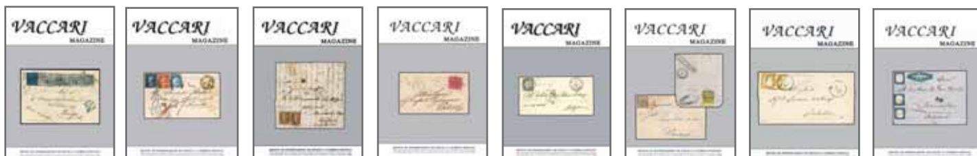
anno 2007 - n. 38 € 5,00 - cod. VM38 anno 2007 - n. 37 € 5,00 - cod. VM37 anno 2006 - n. 36 € 5,00 - cod. VM36 anno 2006 - n. 35 € 5,00 - cod. VM35 anno 2005 - n. 34 € 5,00 - cod. VM34 anno 2005 - n. 33 € 5,00 - cod. VM33 anno 2004 - n. 32 € 5,00 - cod. VM32 anno 2004 - n. 31 € 5,00 - cod. VM31