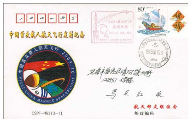
Cina 2003 Busta del primo volo umano cinese.